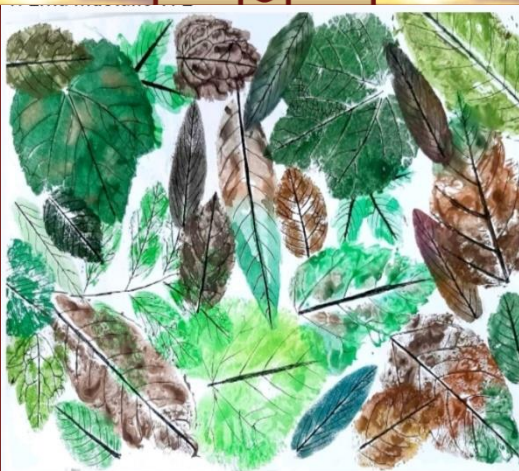
2. Ajla Softić