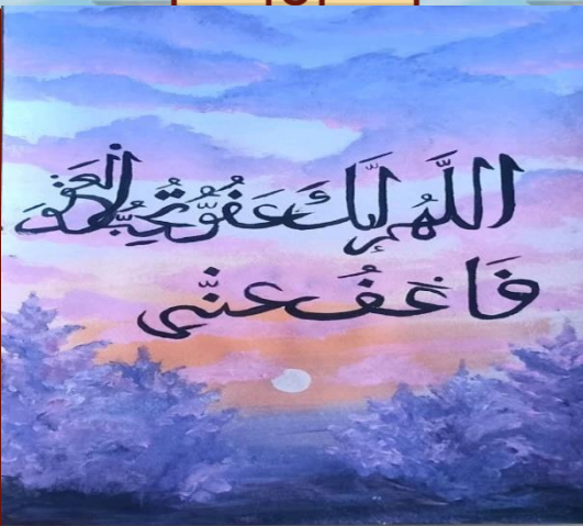
Džanuma Ikanović VIII-1