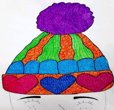
1. Erna Mustafić VI-2